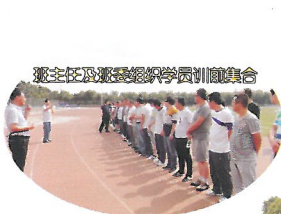
班主任及两县组织专干学员训前集合