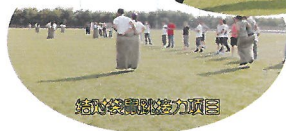
结对袋鼠跳接力项目