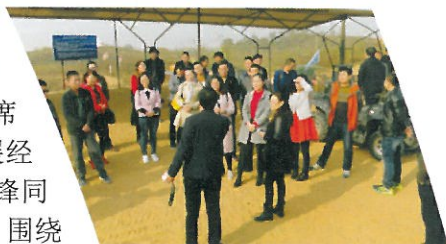
影子培训对接仪式